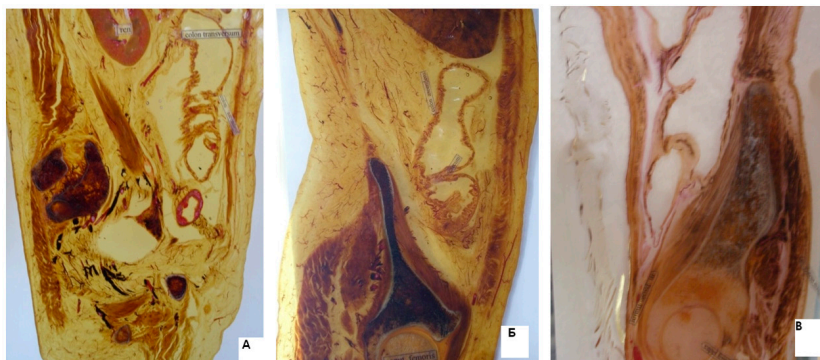
Рисунок 1 – Пластинативные срезы: А – астеника; Б – нормостеника; В – гиперстеника