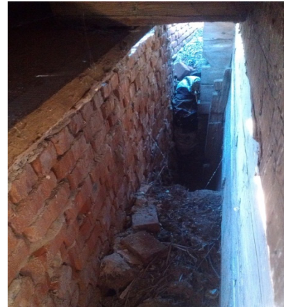
Фото 2 – Отсутствие связи кирпичной облицовки с деревянными стенами здания

перекрытия, что в принципе меняет их статическую работу и приводит к значительной перегрузке несущих конструкций перекрытия. Учитывая, что перекрытия, как правило, также имеют значительные повреждения, то такого рода усиления могут привести к аварийным ситуациям.