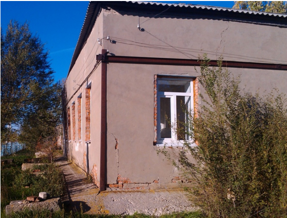
Фото 1 – Сквозные трещины в кирпичной облицовке стены. Отклонение облицовки стен от вертикали наружу здания на величину до 340 мм