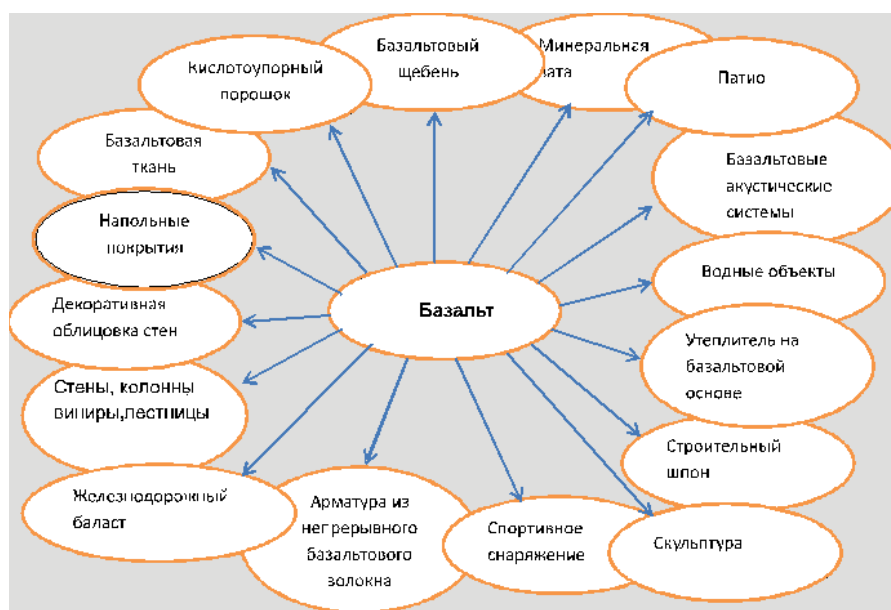
Рисунок 1 – Широта использования базальта

C_4AF ; удельная поверхность 310 \text{ м}^2/\text{кг} ; химический состав цемента: SiO_2 , Al_2O_3 , Fe_2O_3 , CaO , MgO , SO_3 , ППП – 0,5;