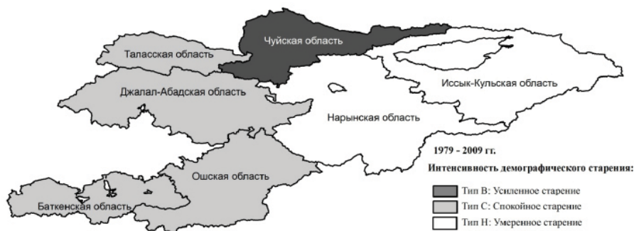
Рисунок 2 – Интенсивность демографического старения сельского населения в разрезе областей Кыргызстана за период 1979–2009 гг. (по Długosz Z., 1998)

Примечание. Р – рост доли пожилого населения; С – стабилизация доли пожилого населения; У – убыль доли пожилого населения.