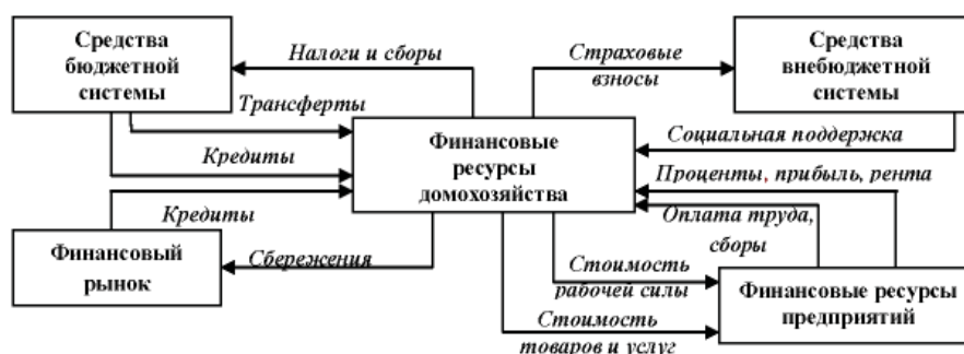
Рисунок 1 – Схема кругооборота финансовых ресурсов домашних хозяйств

в различные финансовые отношения, тесно увязывая все звенья финансовой системы. Размещение финансов домохозяйств в центре экономического кругооборота вполне оправдано и объясняется следующим (рисунок 1).