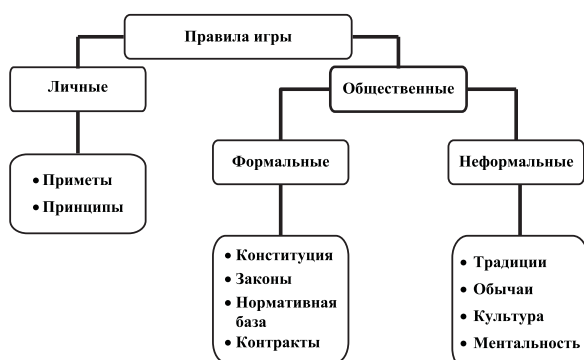
Рисунок 1 – Иерархия “правил игры”

(рисунок 1). Они задают структуру побудительных мотивов, стимулов человеческого взаимодействия, будь то в политике, социальной сфере или экономике. Институты включают все формы ограничений, созданных людьми для того, чтобы придать определенную структуру человеческим отношениям.