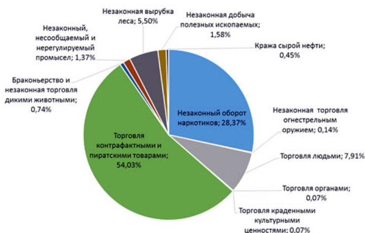
Рисунок 1 – Удельный вес отдельных видов транснациональных преступлений по доходам [3]

окружающую среду и ставят под угрозу здоровье и благополучие общественности.