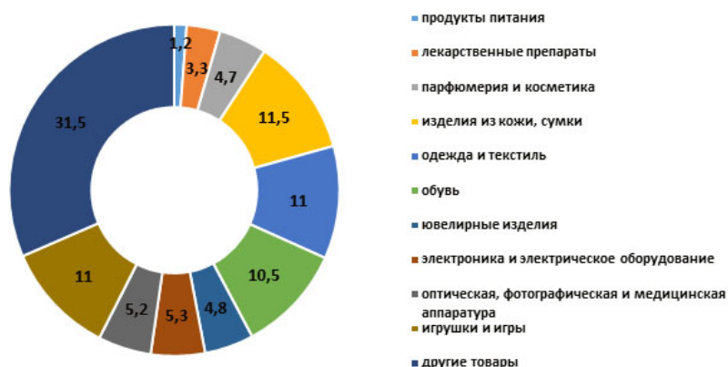
Рисунок 3 – Удельный вес отдельных категорий контрафактных и пиратских товаров по отношению к мировой торговле контрафактными товарами, в процентах [4]

препараты, парфюмерия и косметика, изделия из кожи и сумки, одежда и текстиль, обувь, ювелирные изделия, электроника и электрическое оборудование, оптическая, фотографическая и медицинская аппаратура, а также игрушки и игры (рисунок 3).