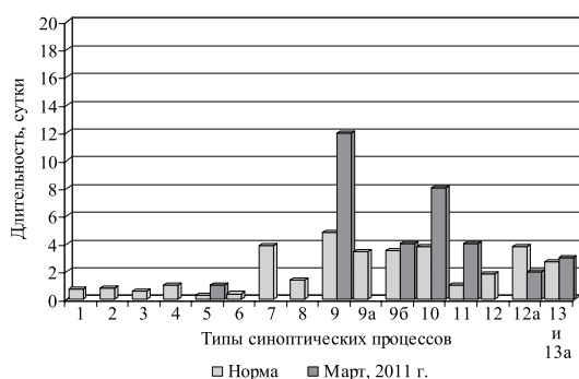
Рис.1. Многолетние средние (нормы) и фактическая суммарная продолжительность типов синоптических процессов в марте 2011 г.

В табл. 2 приведено число дней с градами индекса патогенности по Бишкеку. Его значения в марте изменялись в пределах от 2,0 до 92,9 баллов. Среднее за месяц значение общего индекса патогенности составило 15,8 баллов. В течение марта наблюдалось 24 дня с благоприятными (оптималь-