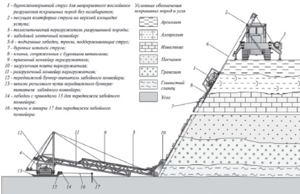
Рис. 2. Технологическая схема поточной разработки крепких вскрышных пород буровзрывным стругом и ленточными конвейерами (на примере угольного месторождения Кара-Кече)