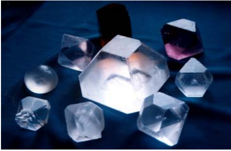
Рис. 2. Синтезированные кристаллы.

Из растворов выращены беспримесные и содержащие примеси кристаллы дигидрофосфата калия, сульфатов и бихроматов щелочных металлов. Исследования физических свойств этих кристаллов различными методами на тот период являлись пионерскими. На научные результаты, полученные в лаборатории, делают ссылки ученые других стран.