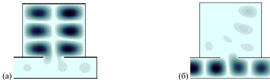
Рис. 2. Поле модуля напряженности электрического поля в настроенном (а) и ненастроенном (б) резонаторе.

Стационарные тепловые состояния керамического образца в резонаторе. Как и в [3–6] получено, что в стационарном случае из-за относительно большой теплопроводности керамического материала поле температуры в керамике слабо неоднородно, несмотря на заметную неоднородность источников тепловыделения (рис. 4). Поэтому тепловое состояние образца вполне характеризуется максимальным значением T_{\max} температуры, которая неоднозначно определяется заданием подводимой СВЧ мощности P_1 микроволнового излучения. При задании в качестве внешнего электродинамического параметра задачи диссипируемой в керамике мощности рассчитанная совокупность стационарных состояний в плоскости (P_1, T_{\max}) образует нелинейную зависимость T_{\max}(P_1) , имеющую характерную S-образную форму (рис. 5). В определенном диапазоне каждому значению СВЧ мощности соответствуют несколько стационарных состояний, образующих последовательность чередующихся между собой устойчивых (на ветвях с dT_{\max}/dP_1 > 0 ) и неустойчивых ( dT_{\max}/dP_1 < 0 ) решений. Устойчивость состояний определяется из физических соображений по отношению к флуктуациям температуры.