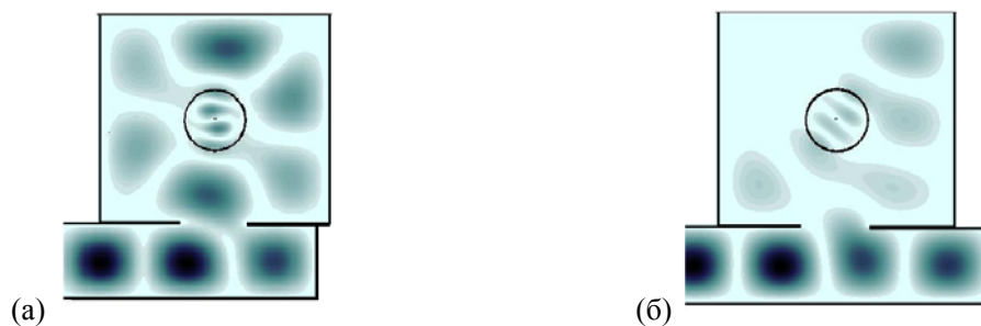
Рис. 3. Поле модуля напряженности электрического поля в настроенном (а) и ненастроенном (б) резонаторе с керамическим образцом.