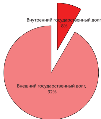
Рис. 1. Структура государственного долга КР на 01.12.2006.

конец декабря 2006 г. Наибольший удельный вес составлял внешний государственный долг – 91,53%, соответственно на внутренний государственный долг приходилось 8,47% [2].