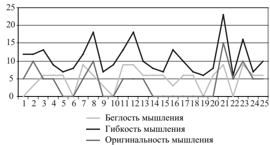
Рис. 3. Результаты субтеста Дж. Гилфорда.

вергентного мышления, как легкость, продуктивность мышления (беглость), способность к быстрому переключению (гибкость), своеобразие, необычность подхода к проблеме (оригинальность). Результаты данного теста представлены на диаграмме (рис. 3).