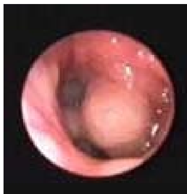
Рис. 4. Аденоиды 2–3 ст. в задних отделах носа.