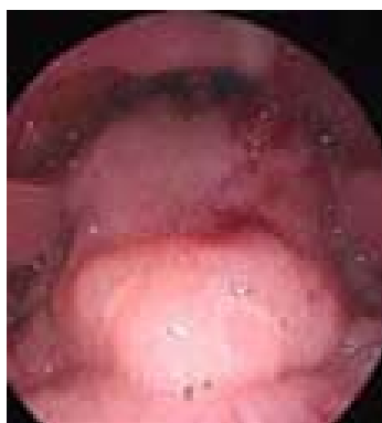
Рис. 1. Эндоскопическая картина, (Эпифарингоскопия)

Выводы. Таким образом, причинами некачественной аденотомии являются: «слепая» техника аденотомии, которая к сожалению, не лишена недостатков – неполное удаление