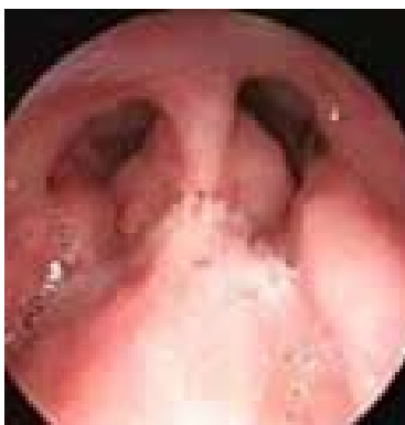
Рис. 3. Аденоиды 2–3 ст. в области хоан.