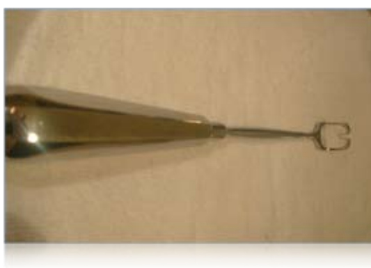
Рис. 5. Модифицированный аденотом.