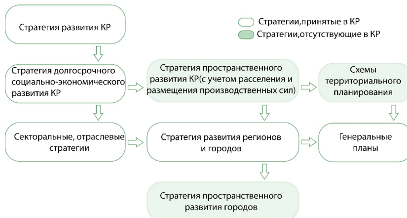
Рисунок 1 – Предлагаемая логическая схема государственного стратегического планирования с учетом СПР разных уровней

согласования и утверждения схем и проектов районной планировки, планировки и застройки городов, поселков и сельских населенных пунктов” [7]. Дата актуализации: 01.02.2020 (в настоящее время действует на территории Российской Федерации – правопреемника бывшего советского союза). В Кыргызской Республике таких инструкцией нет.