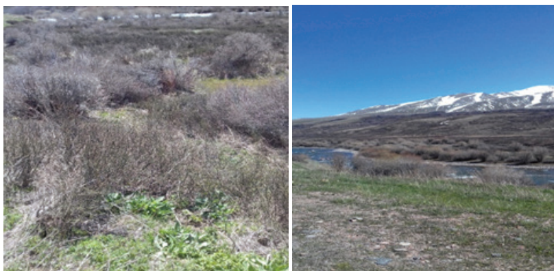
1-сүрөт – Алтыгана бадалынын Суусамыр өрөөнүндө жайылышы

Caragana aurantiaca тикенектүү жыш бутактуу, бийиктиги 50–60 см, кээ бир жерлерде 100–120 см болгон чакан жайылган бадал. Жалбырактары катарлашып, топтошуп өсөт, гүлдөрү эки урук мүчөлүү, бирден же 2–5 топ-тобу менен, сары же алтын сымал сары болуп гүлдөйт. Майдын аягында же июндун баштарында гүлдөп баштайт жана бул процесс 1,5–2 жумага созулат. Буурчагы узунураак чөйчөкчө болуп, ачылууда экиге бөлүнүп буралат. Алтыгана бадалы Орто Азияда, Тянь-Шань, Казакстандын түндүк – чыгышында, Кытайда, Афганистанда, Пакистандын батышында жана Гималайдын батышында жайылган. Ошондой эле алтыгана ландшафты климаты континенталдуу, кыш мезгили кардуу, суук жана узакка созулган, ал эми жайы салкын жана мелүүн, суткалык жана жылдык жогорку температуралык амплитудада, деңиз деңгээлинен 2100 м жогору бийиктикте (төмөнкү точкасы) туюк бийик тоолу Суусамыр өрөөнүндө жайгашкан. Өрөөндүн бийик жерлеринде (2600–2700 м деңиз деңгээлинен бийик) жайылган алтыгана бадалынын жаш көчөттөрүнүн багыты ортороптук (тикесинен өскөн) өсүүдөн плагиатроптук (жалпак өскөн) өсүүгө өзгөрөт. Бутактары жерге тийип, тамырга айланyp, узундугу кыскарат. Кийин алар өз алдынча өсүп башташат, ошондой эле үрөнү аркылуу көбөйүү процессине дагы ээ [1–5]. Суусамыр дарыясынын жайылмаларында өөрдөп өскөн алтыгана бадалынын көрүнүшү төмөнкү сүрөттө көрсөтүлгөн (1-сүрөт).