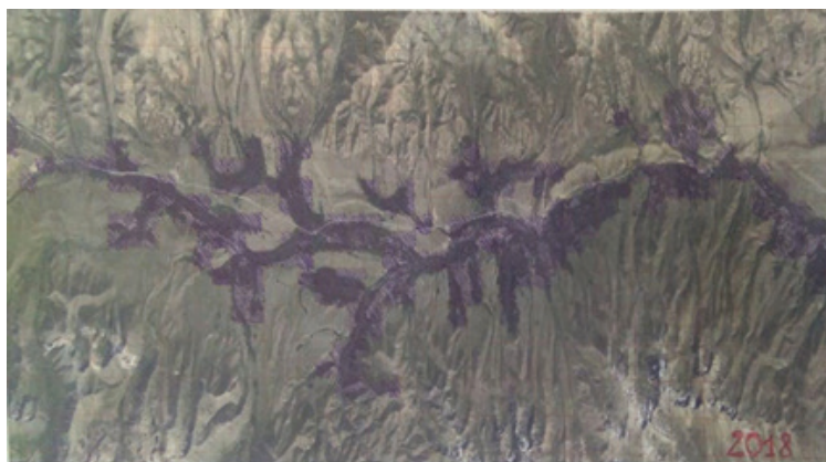
6 сүрөт – Суусамыр өрөөнүндөгү алтыгана бадалынын каптаган аянты 2010 - жыл. Болжолдуу эсептелген аянты \approx 52 \text{ км}^2 1 см: 1 км, 1:100000