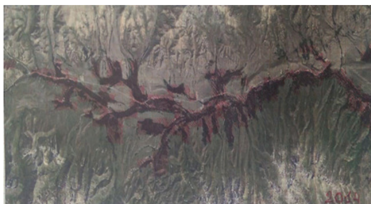
4 сүрөт – Суусамыр өрөөнүндөгү алтыгана бадалынын каптаган аянты 2014 - жыл. Болжолдуу эсептелген аянты \approx 48,5 \text{ км}^2 1 см: 1 км, 1:100000