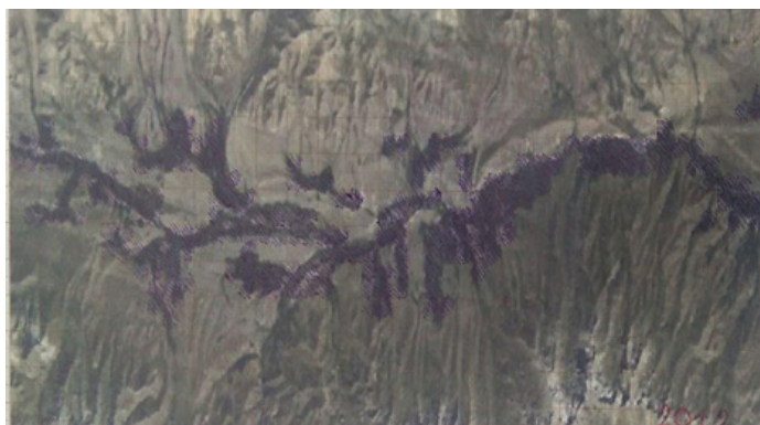
3 сүрөт – Суусамыр өрөөнүндөгү алтыгана бадалынын каптаган аянты 2012 - жыл. Болжолдуу эсептелген аянты \approx 48 \text{ км}^2 1 см: 1 км, 1:100000