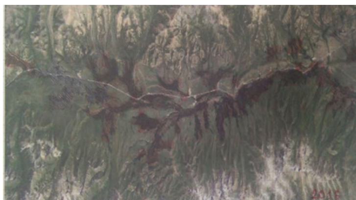
5 сүрөт – Суусамыр өрөөнүндөгү алтыгана бадалынын каптаган аянты 2016 - жыл. Болжолдуу эсептелген аянты \approx 49,5 \text{ км}^2 1 см: 1 км, 1:100000