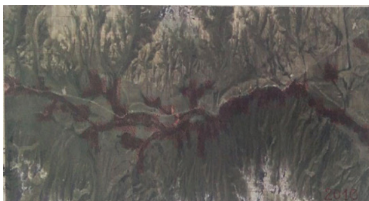
2 сүрөт – Суусамыр өрөөнүндөгү алтыгана бадалынын каптаган аянты 2010 - жыл. Болжолдуу эсептелген аянты \approx 36,5 \text{ км}^2 1 см: 1 км, 1:100000