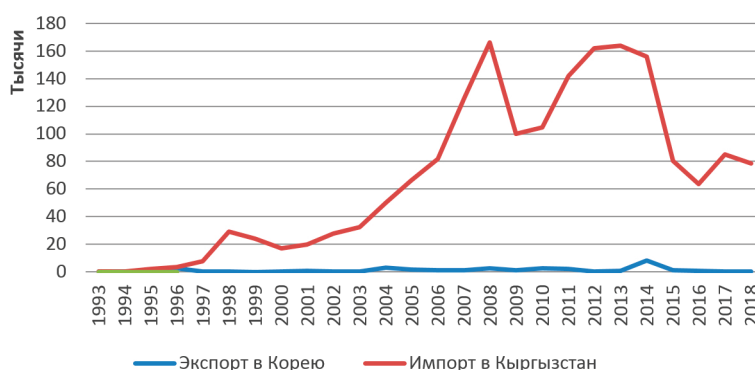
Рисунок 3 – Экспорт и импорт из Южной Кореи [2]

уменьшается импорт новых автомобилей на 96 %. С другой стороны, в 2017 г. по сравнению с 2016 г. импорт новых автомобилей увеличивается на 95,1 %, импорт машин, предназначенных для конкретных отраслей, увеличивается на 82 %. Импорт сотовых телефонов увеличивается на 26 %.