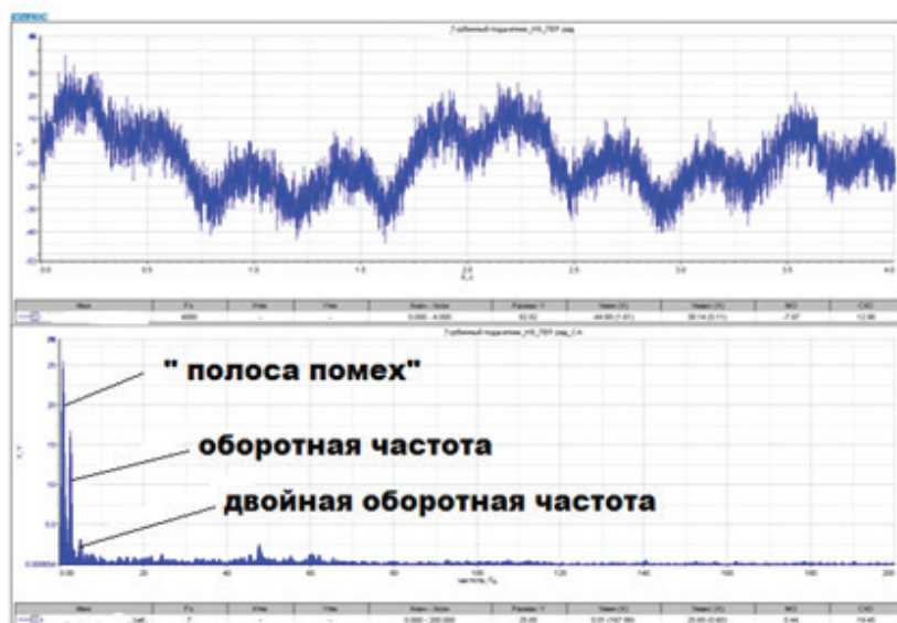
Рисунок 2 – Сигнал виброперемещения в полосе частот 0,2–200 Гц

используя рисунок 1, производили оценку состояния узла гидроагрегата. Это принято называть оценкой по общему уровню.