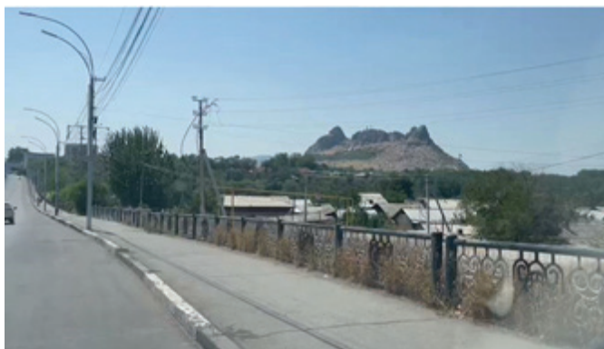
Рисунок 3 – Вид с моста ул. Абдыкадырова (фото)