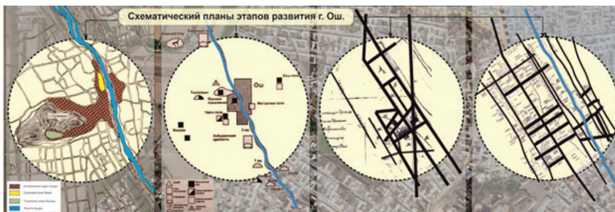
Рисунок 2 – Схемы планов города в разные периоды

Таким образом, анализ градостроительного освоения города с древнего периода по настоящее время позволяет уточнить этапы развития его планировки и рассмотреть видовые взаимосвязи градостроительной и природной доминанты Сулайман-Тоо с историческими объектами города (рисунок 2).