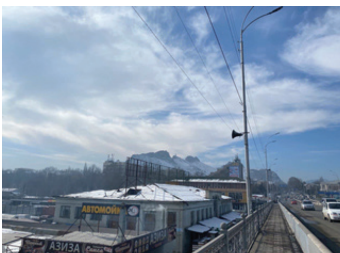
Рисунок 4 – Вид с моста по ул. Навои (фото)

на основных городских магистралях города Алишера Навои и Абдыкадырова являются наилучшими местами визуального восприятия силуэта Сулайман-Тоо с юго-восточной стороны (рисунки 3, 4).