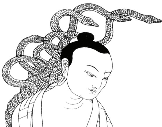
Рисунок 1 – Изображение Арьи Нагарджуны [2]

В-третьих, все объекты зависят от конвенции (наименования). Мы постоянно получаем и организуем огромное количество информации – цвет, форма, фактура, воспоминания и ассоциации. Собирая атрибуты вместе, мы именуем объект, тем самым конструируя его независимое существование. Наделяя независимым существованием сконструированный объект, мы