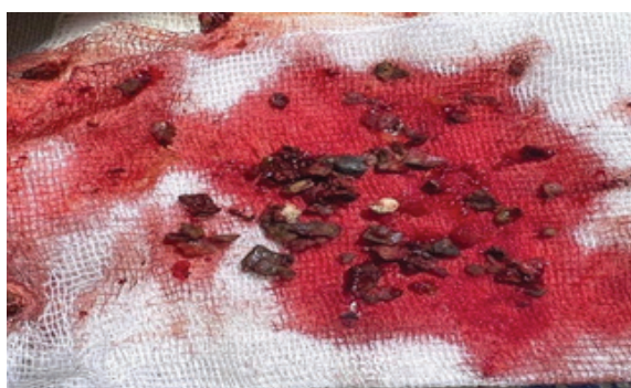
Рисунок 2 – Макропрепараты – удаленные фрагменты грибкового тела (кальцинаты, полипы, неправильной формы инородное тело)

вероятным. КТ-данные за левосторонний фронтотэтмоидит, пристеночное, полиповидное утолщение слизистой оболочки в верхнечелюстной пазухе слева, искривление носовой перегородки, гипертрофические изменения нижних носовых раковин. КТ-признаки наличия одонтогенных кист в области дна верхнечелюстной пазухи слева (рисунок 1).