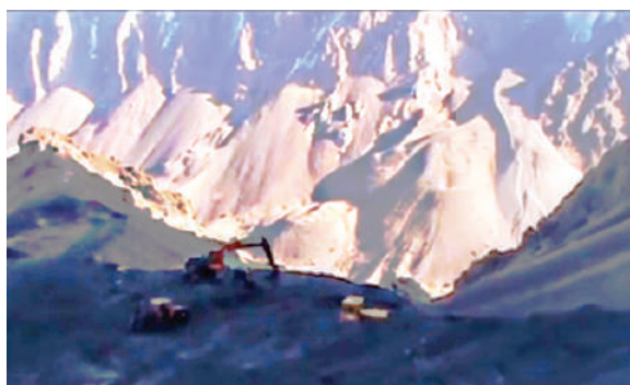
Вскрыша и добыча угля экскаватором