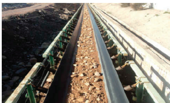
Магистральный конвейер для породы