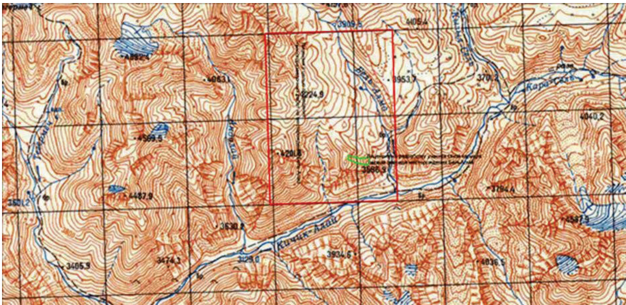
Рисунок 1 – Расположение месторождения «Бель-Алма»: на общей карте-схеме Кыргызской Республики (вверху); на карте в Алайском районе (внизу – кружочек с отм. 3586,9)