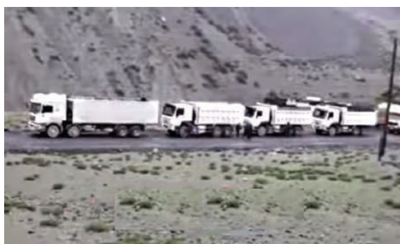
Автосамосвалы в очереди за погрузкой (лето)