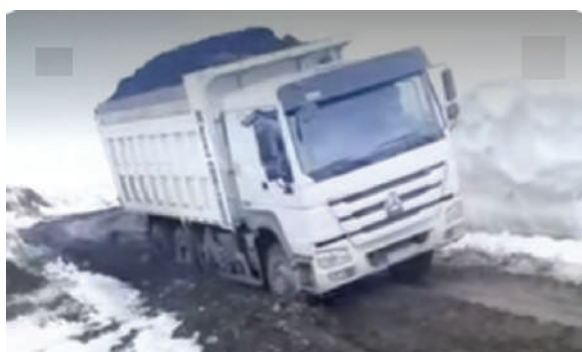
Вывоз угля из разреза автосамосвалом (зима)