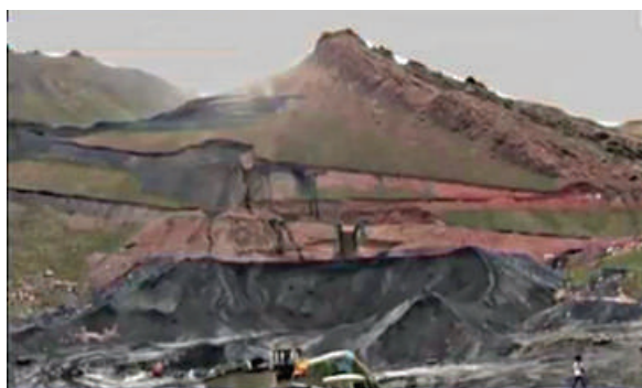
Вид участка угольного разреза «Бель-Алма»

Угольный разрез «Бель-Алма» является одним из крупных по запасам на юге Кыргызстана, который может обеспечить углем весь южный регион. Поэтому разработка и внедрение на этом разрезе