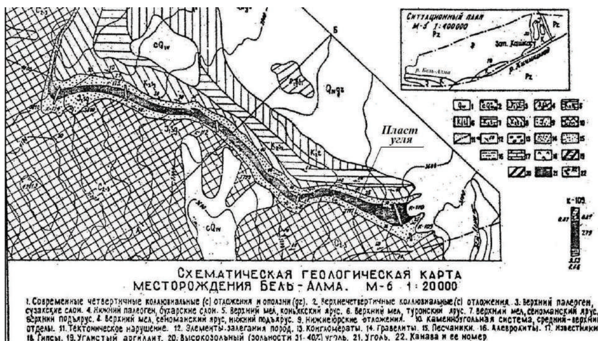
Рисунок 2 – Схематическая геологическая карта месторождения «Бель-Алма»

1:10000, 1:50000), прогнозные запасы угля определялись по категории P_1 (до глубины 300 м от поверхности земли) в объеме 90 млн т.