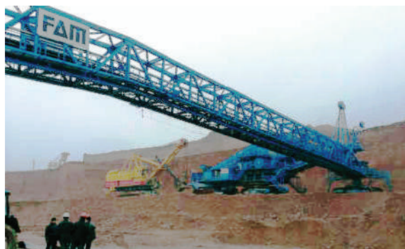
Комплекс мобильной дробилки с мостовым перегружателем (виды сверху и спереди)