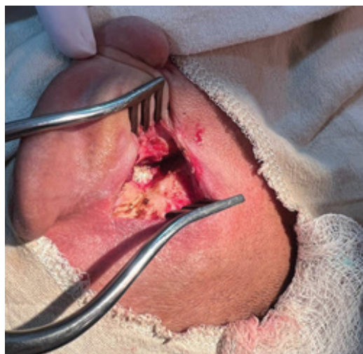
Рисунок 1 – Состояние во время операции

Консервативное лечение в течение 5 дней, включающее антибактериальную терапию и местное лечение. Положительной динамики не отмечалось, после чего пациент был взят на санную радикальную операцию на среднем ухе справа.