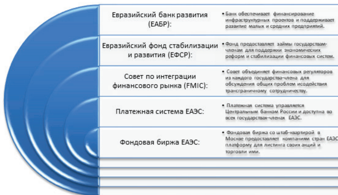
Рисунок 1 – Основные механизмы сотрудничества*