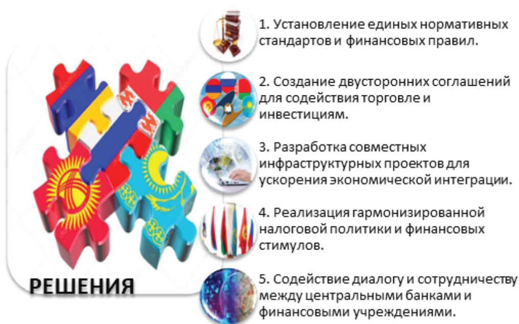
Рисунок 3 – Решения сотрудничества между странами-членами ЕАЭС*

ограничения на иностранные инвестиции, может ограничить трансгранично кредитование и инвестиции в регионе. Это может замедлить развитие более интегрированного финансового рынка и привлечение иностранных инвестиций.