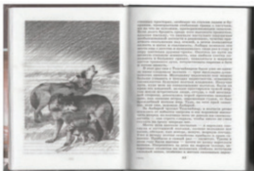
Рисунок 7 – Волчье семейство.

Иллюстрация к произведению Ч. Айтматова «Плаха»