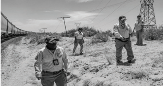
Рисунок 2 – Сотрудники иммиграционной службы Мексики в Самалаюке, Мексика. 13 мая 2023 г.

вещи, предметы или объекты, наблюдается и в следующих примерах. Так, на другой фотографии изображены сотрудники иммиграционной службы Мексики, которые проводят инспекцию поезда «Зверь» для мигрантов и лиц, ищущих убежища, в попытке сократить поток мигрантов в направлении границы с Соединёнными Штатами в Самалаюке, в Мексике (рисунок 2) [4, с. 1].