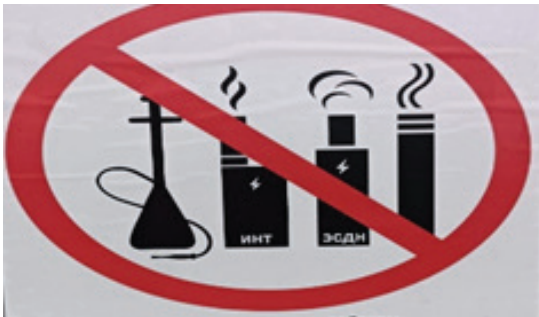
Рисунок 5 – ИИТ – изделия с нагреваемым табаком ЭСДН – электронные системы доставки никотина

в качестве синтаксического эквивалента члена предложения. Примерами могут послужить невербальные знаки на плакатах в одном из столичных общеобразовательных учреждений, запрещающие электронные сигареты или любые другие табачные изделия с нагреваемым табаком (рисунок 5). Особенность дейктической связи заключается в том, что в вербальном компоненте содержатся указание на изобразительный компонент, отсылка к нему адресата.