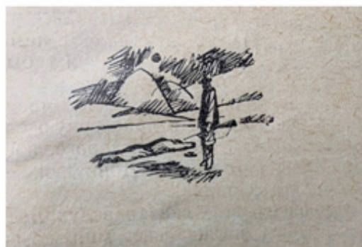
Рисунок 8 – Потрясённый горем Бостон.

Вдобавок в романе преобладают изображения, иллюстрирующие уклад жизни некоего волчьего семейства в степном краю саванны.