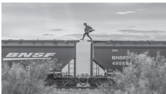
Рисунок 4 – Мигрант забирается на грузовой поезд "Зверь" в Пьедрас-Неграс, Мексика. 8 октября 2023 года.

остановках по пути следования поезда на север (рисунок 4) [6, с. 1].