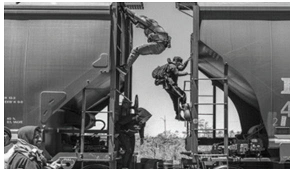
Рисунок 3 – Венесуэльские мигранты высаживались из "Зверя" по пути в Сьюдад-Хуарес, Мексика. 8 мая 2023 г.

и исполнению строгих миграционных законов затрудняет поиск убежища для людей. Таким образом, соблюдение строгой миграционной политики США и Мексики создаёт физические, психологические и административные барьеры для тех, кто больше всего нуждается в безопасности. Итак, на следующей фотографии венесуэльские мигранты высаживались из «Зверя» по пути в Сьюдад-Хуарес в Мексике в попытке пересечь границу до истечения срока действия закона по предотвращению COVID-19, принятого Соединёнными Штатами, который позволяет депортировать мигрантов без рассмотрения их ходатайств о предоставлении убежища. Ближе к концу периода действовавшего закона наблюдался наплыв мигрантов, пытавшихся въехать в Соединённые Штаты и попросить убежища, прежде чем им могли быть предъявлены уголовные обвинения в соответствии с законом (рисунок 3) [5, с. 1].