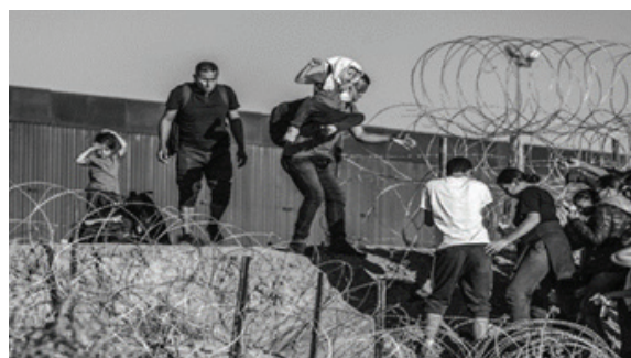
Рисунок 1 – Мигранты и лица, ищущие убежища, попытались пересечь участок колючей проволоки в Сьюдад-Хуаресе, Мексика. 06 мая 2023 г.

Для анализа рассмотрим фотографию, на которой мигранты и лица, ищущие убежища, попытались пересечь участок колючей проволоки, установленный Национальной гвардией Техаса в Сьюдад-Хуаресе, в Мексике (рисунок 1) [3, с. 1]. Итак, здесь и изображение, и вербальная подпись под изображением обозначают одни и те же предметы или объекты действительности, а точнее, изображение беженцев, пытающихся пересечь границу Мексики.