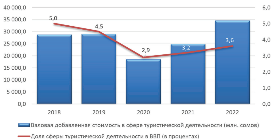
Рисунок 2 – Валовая добавленная стоимость туризма в Кыргызской Республике, 2018–2022 годы