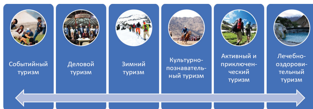
Рисунок 1 – Классификация видов туризма в Кыргызской Республике