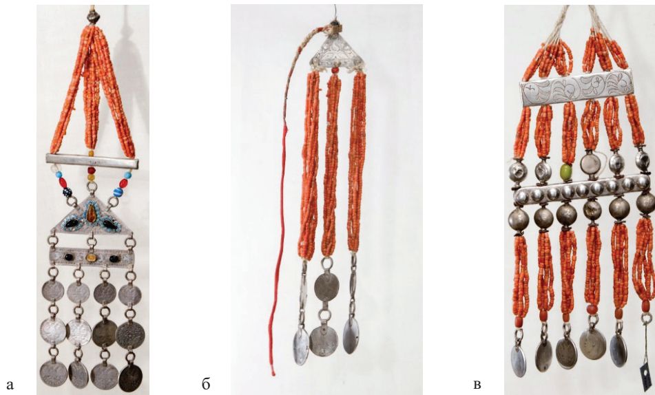
Рисунок 6 – Чач учтук (а). КП 5818-995 КНМИИ им. Г. Айтиева; Чач учтук (б). КП 7404-2003 КНМИИ им. Г. Айтиева; Чач учтук (в). КП 8706-2326 КНМИИ им. Г. Айтиева