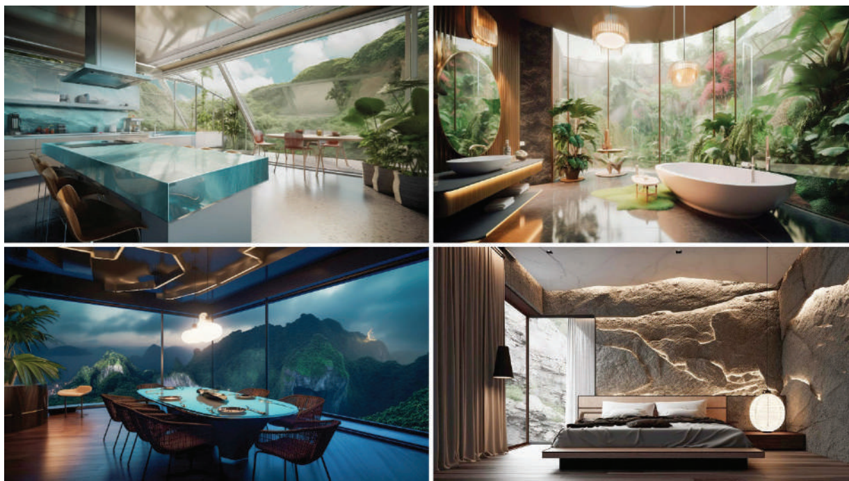
Рисунок 4 – Вид интерьеров дома