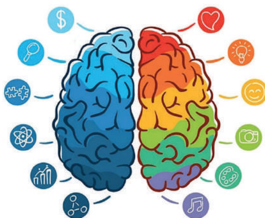
Рисунок 5 – Функциональная асимметрия полушарий головного мозга

Нейропсихологи, исследующие функции головного мозга, отмечают функциональную асимметрию полушарий головного мозга. Левое полушарие – вербальное, логическое, «рассудочное» пользуется механизмами последовательного анализа информации, обработка информации происходит аналитически, последовательно. Правое полушарие – невербальное, образное, ассоциативное, оно воспринимает действительность целиком, обработка информации происходит глобально. Оно предназначено для пространственно-зрительных функций, интуиции, музыки, эмоционально-целостного восприятия, синтетического, ситуационного мышления. Правое полушарие... обрабатывает информацию одно-моментно (холистически), целостно, обрабатывает одновременно большое количество элементов, что обеспечивает образный охват ситуации, формируя полный образ из фрагментов [10]. Ученые, исследующие высшую мозговую деятельность человека, отмечают сложный характер взаимодействия частей головного мозга, но обобщенно сходятся во мнении, что левое полушарие отвечает за логику, аналитическое или научное мышление, а правое – за образное, синтетическое или художественное мышление (рисунок 5). При этом они отмечают определенную асимметрию у каждого индивида, у кого-то доминирует правое, а у кого-то левое полушарие. Эта асимметрия проявляется с младенческих лет, то есть заложена генетически. Одни люди больше проявляют склонность к науке, тогда как другие к искусству.