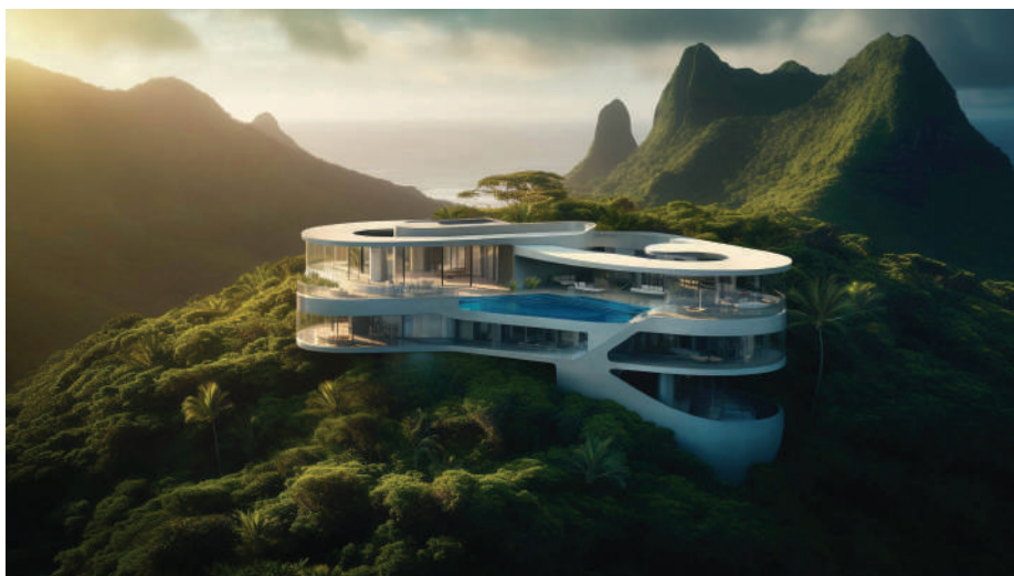
Рисунок 3 – Изображение дома с другого ракурса