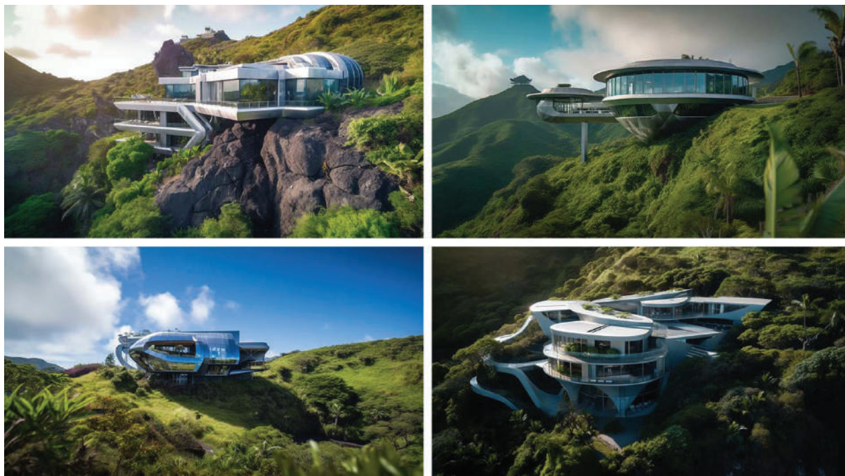
Рисунок 2 – Сгенерированные искусственным интеллектом варианты дома по словесному описанию

Нейронные сети уже достаточно проявили себя в таких сферах искусства, как музыка и двухмерная графика. Нейросети, создающие двухмерную графику по вербальному описанию, переживают бурный рост и эти программы уже делятся по жанрам, тематике и стилистическим направлениям [7]. Даже такая широко распространенная графическая программа как Photoshop добавила модули, работающие с нейросетями. Музыка пишется искусственным интеллектом также по словесному описанию, в интернете достаточно много ее примеров, хотя пока не видно крупных музыкальных произведений [8].