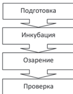
Рисунок 2 – Грэм Уоллес: четыре стадии творческого процесса

Процессы научного и художественного творчества предполагают генерирование новых и ценных идей, однако они различаются по нескольким ключевым аспектам, включая цели, методологии,