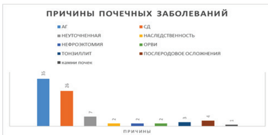
Рисунок 3 – Причины ХБП

В ходе исследования историй болезней пациентов были выявлены наиболее частые причины ХБП, результаты которых представлены в следующей диаграмме (рисунок 3).