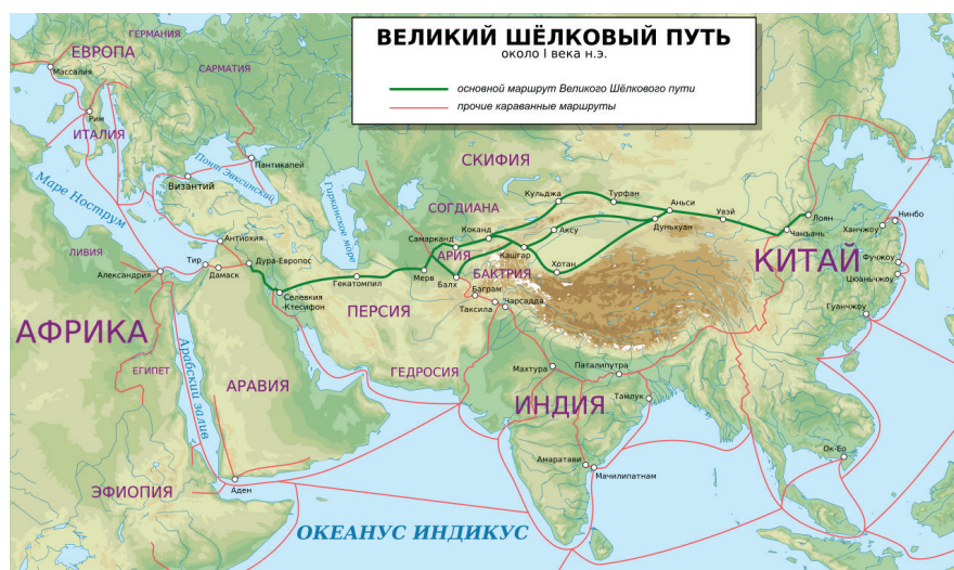
Рисунок 1 – Великий Шёлковый путь и другие караванные маршруты Евразии в I веке н. э. [14]

Позже, в V–VII веках, появляются согдийские колонии [13]. Л.Р. Кызласов в своём Отчёте об археологических исследованиях на городище