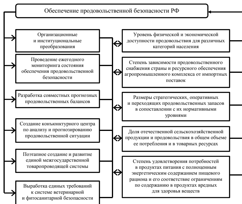
Рисунок 2 – Предлагаемая система обеспечения продовольственной безопасности РФ

В настоящее время в России на уровне или с небольшим отклонением от рекомендуемых ра-