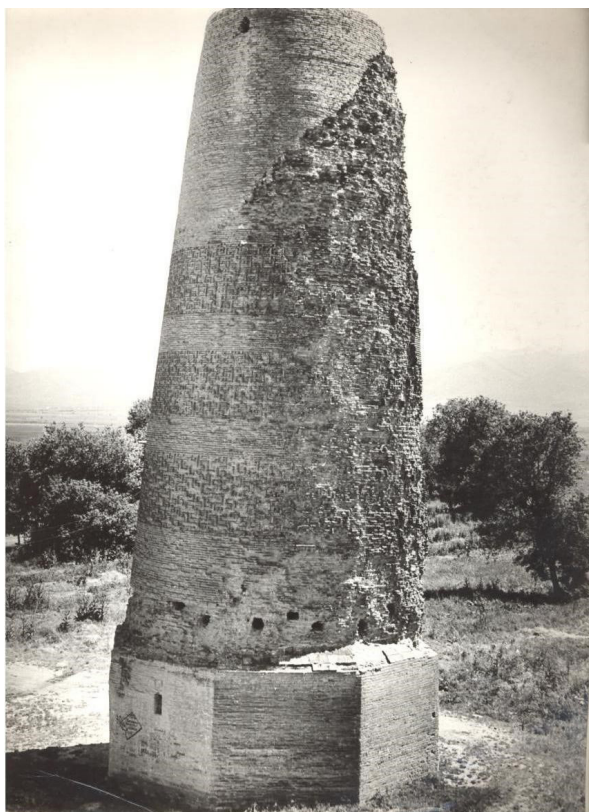
Рисунок 1 – Бурана. Самый древний из сохранившихся минаретов Средней Азии. Конец X в.

в работе Б.П. Денике «Архитектурный орнамент Средней Азии» [12, с. 22].