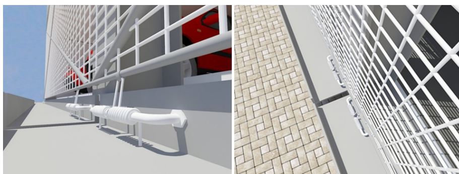
Рисунок 3 – КДГКТТ в комбинации с конструкцией легкого сетчатого ограждения гаража-стоянки легковых автомобилей

Использование комбинированного динамического гасителя колебаний предлагаемой конструкции позволяет эффективно гасить колебания при сейсмических и ветровых воздействиях.