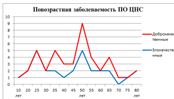
Рисунок 2 – Повозрастная заболеваемость доброкачественными и злокачественными формами первичных опухолей центральной нервной системы во второй группе больных