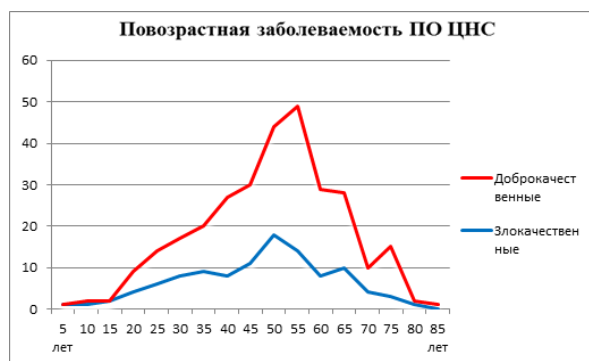
Рисунок 1 – Повозрастная заболеваемость доброкачественными и злокачественными формами первичных опухолей центральной нервной системы в первой группе больных