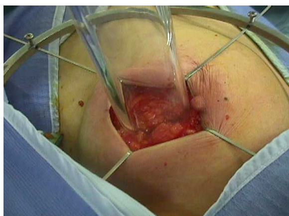
Рисунок 3 – Наложение аппликатора для проведения интраоперационной лучевой терапии

При проведении интраоперационной лучевой терапии наблюдались осложнения, частота которых была низкой.