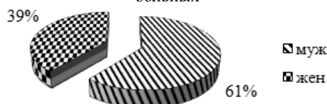
Рисунок 1 – Возрастное распределение исследуемых больных