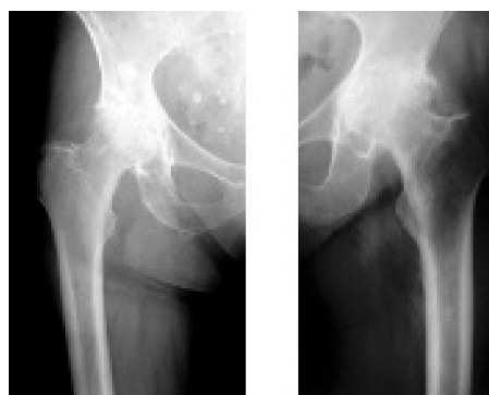
Рисунок 2 – Рентгенограммы пациента 3. до операции

Клинический пример 1. Пациентка 3., 71 год. Диагноз: Первичный двусторонний коксартроз 3 степени. Длительность заболевания – около 8 лет. Пенсионерка, не работает. Рентгенологическая картина соответствует типичному варианту первичного коксартроза (рисунок 2).