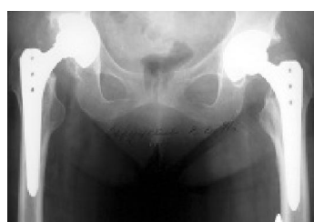
Рисунок 4 – Рентгенограмма пациента 3. после тотального эндопротезирования левого тазобедренного сустава