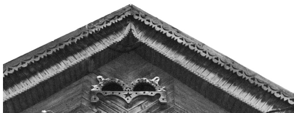
Рисунок 1 – Фронтон жилого дома в с. Александровка (начало XX в.). Фото автора, 2017 г.

архитектуры усадебного дома. В данной статье рассматривается развитие архитектурно-художественного убранства малоэтажных жилых домов г. Бишкек и в целом севера Кыргызстана.