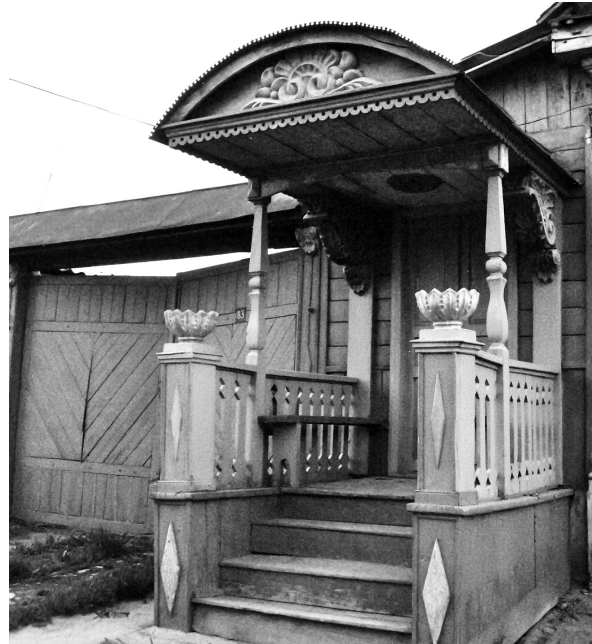
Рисунок 4 – Крыльцо в г. Каракол (конец XIX – начало XX в.). Фото автора, 2016 г.

Богаче всего украшались окна. Окна переселенческих жилищ конца XIX начала XX века украшены богатыми наличниками. Верхняя перекладина наличника – очелье, как правило, шире других элементов, украшалось разным декором, в зависимости от сложности оно делилось на несколько составных частей (рисунок 3). В древнеславянской мифологии окна служили местом проникновения в дом невидимых злых духов, приносивших болезни и несчастья. Часть узоров вокруг окна носит магический-заклинательный характер, призванный служить барьером для нежелательных сил. Также в узорах чувствуется влияние самых различных источников, начиная с простых геометрических,