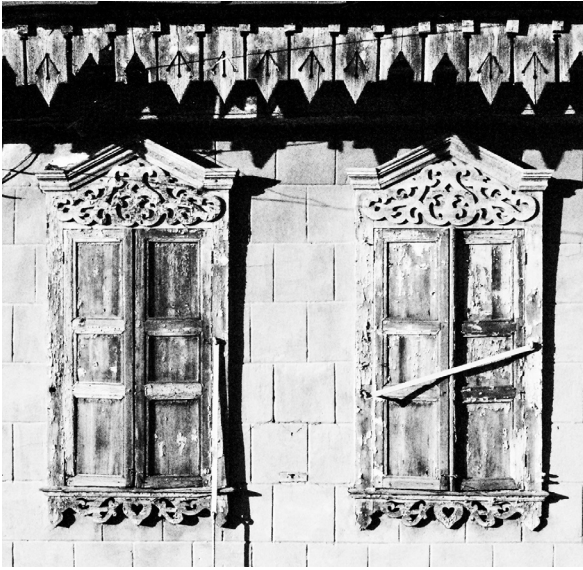
Рисунок 3 – Окна со ставнями г. Каракол (конец XIX – начало XX в.). Фото автора, 2016 г.

кладке этих элементов, изготавливаемых в основном из небольших дощечек. Получалось некое подобие паркетной кладки.