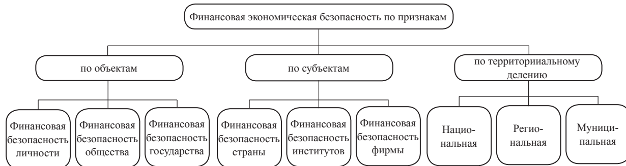
Рисунок 2 – Классификация финансово-экономической безопасности по признакам (схема разработана автором самостоятельно)