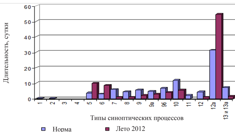
Рисунок 1 – Многолетние средние (нормы) и фактическая суммарная продолжительность типов синоптических процессов летом

В Бишкеке 15, 20, 21, 22, 23 августа были перекрыты многолетние максимальные температуры этих дней, а 22 августа температура воздуха повысилась до 39,7 °С, что выше абсолютного многолетнего максимума этого месяца, зарегистрированного в 2008 г., на 0,2 °С.