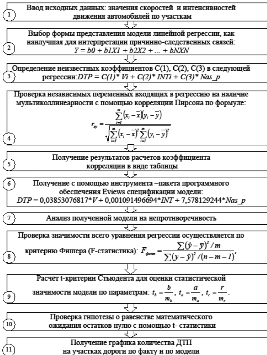
Рисунок 1 – Оперативная блок-схема (алгоритм) решения задачи влияния скорости и интенсивности движения на количество ДТП на автодороге Бишкек–Ош

анализа факторами, совместно воздействующими на общий результат, которая затрудняет оценивание регрессионных параметров. Коэффициент корреляции Пирсона характеризует существование линейной зависимости между двумя величинами и рассчитывается по формуле [2]: