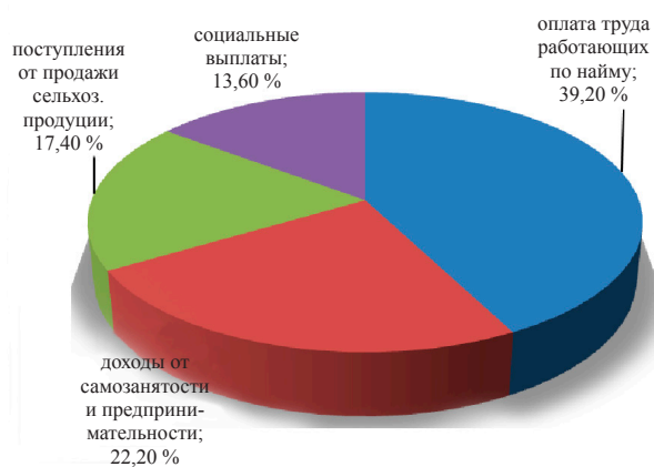
Рисунок 1 – Структура доходов населения Кыргызской Республики в 2010 г.