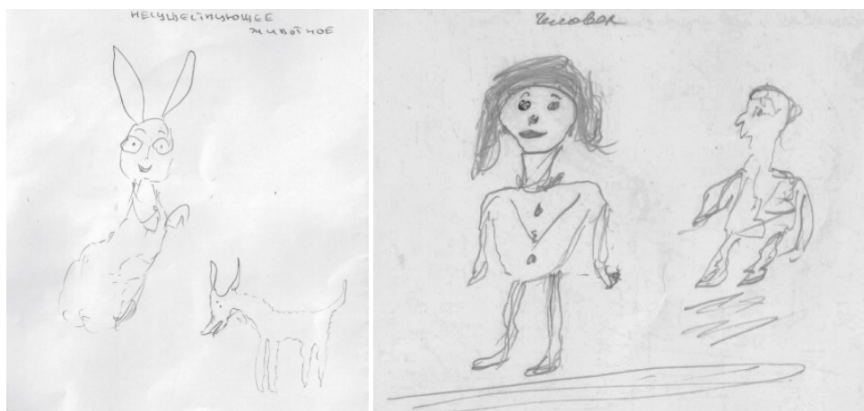
Рис. 3. Примеры изображений нескольких фигур в группе медицинских работников (тест “Нарисуй человека” и “Несуществующее животное”)

Подобный же феномен нами обнаружен в рисунках медицинских работников, которые оказались в чрезвычайных ситуациях, опасных для жизни (события в июне 2010 в г. Ош). Но двойные фигуры были только в тесте “Нарисуй человека” (1,28 %) и в тесте “Несуществующее животное” (3, 8%).