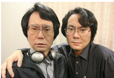
Рис.1. Хироси Исигуро и его робот-двойник [Интернет ресурс]

Известным фактом остается и то, что в 2006 году японский инженер Хироси Исигуро (Hiroshi Ishiguro) изобрел робота – двойника. Андроид представляет собой точную копию ученого.