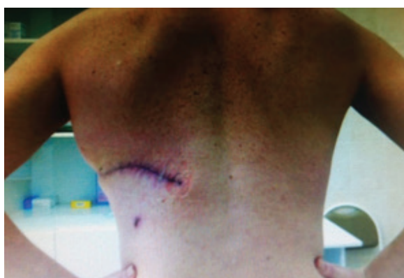
Рисунок 1, б – То же (после операции, вид сзади)

мо, сбоку). При выполнении операции края резецированной молочной железы были свободными от опухоли. Необходимо отметить, что