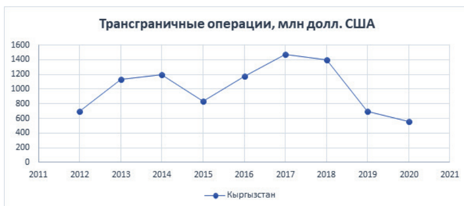
Рисунок 4 – Трансграничные операции (сумма переводов из России в Кыргызстан)**