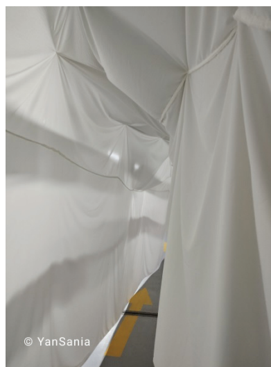
Рисунок 3 – Инсталляция посвящена проблеме таяния ледников. Культурный центр «Кудук»

Общество, не обращающее внимание на экологию, развивается в неправильном направлении: сохранение природы перерастает в проблему выживания. Осознание человечеством проблемы восстановления баланса «я – природа» может снять напряжение во взаимоотношениях между обществом и окружающей средой. Изменение климата – не миф, а таяние ледников – это экологическая проблема. Ледники являются базой данных о климате прошлого, слои ледника хранят информацию сотни тысяч лет. Экоарт-выставка «Кондиционер не работает» продемонстрировала и дала почувствовать последствия изменения климата. Одни из самых ярких впечатлений – рукотворный тоннель в «сердце ледника» (рисунок 3) и звук капающей воды – дали возможность посетителям почувствовать, что «вечный лёд» оказался хрупок перед современной цивилизацией, что даёт понимание о неизбежности перемен. Экоарт-выставка – это мероприятие, где идёт визуализация переживаний и мыслей различных