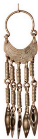
Рисунок 4 – Кольцевые серьги жети аяк . КП 4313-524 КНМИИ им. Г. Айтиева