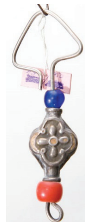
Рисунок 8 – Стержневые серьги. КП 7614-2090 КНММИИ им. Г. Айтиева

форму делали в виде листика, такие серьги называли жалбырак сөйкө (рисунок 7). Поверхность этих серег украшалась орнаментом, выполненным насечкой, чеканкой, гравировкой, чернью. В отличие от сандыкча сырга , орнамент плоских серег был более изящен и разнообразен.