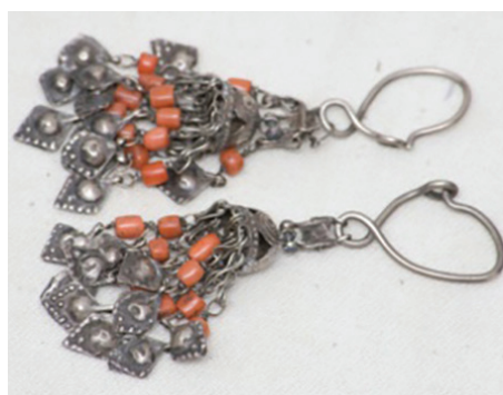
Рисунок 2 – Кольцевые серьги махмеди . КП 6707-1164 КНМИИ им. Г. Айтиева