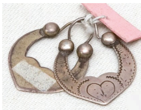
Рисунок 1 – Кольцевые серьги ай сырға . КП 6705-1162 КНМИИ им. Г. Айтиева