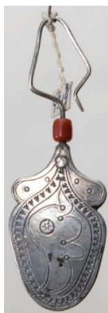
Рисунок 7 – Цельнокованные серьги жалбырак сөйкө . КП 4319-530 КНММИИ им. Г. Айтиева