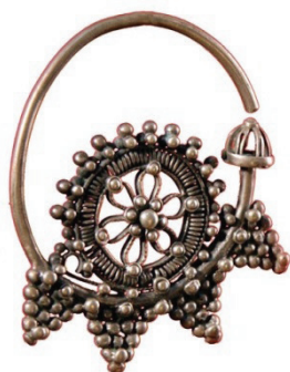
Рисунок 3 – Кольцевые серьги кашгар сырга (зере балдак). КП 5266-745 КНМИИ им. Г. Айтиева

Плоские серьги – жалтак сырга . Также как и объемные, их выковывали вместе с дужкой из цельного прута, но основу сплющивали, придавая ей геометрическую или фигурную форму. Иногда эту