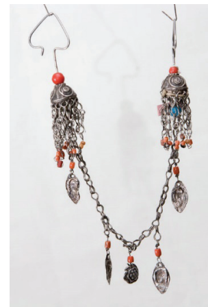
Рисунок 9 – Стержневые серьги сагак сөйкө . КП 3473-243 КНМИИ им. Г. Айтиева