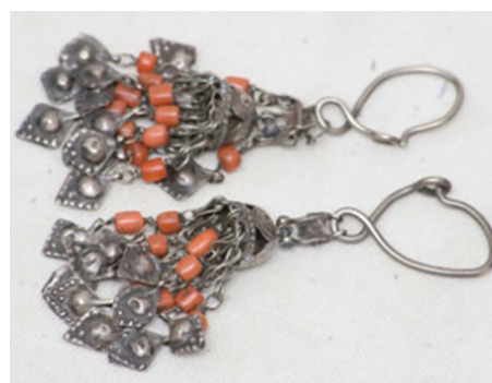
Рисунок 2 – Кольцевые серьги махмеди . КП 6707-1164 КНММИИ им. Г. Айтиева