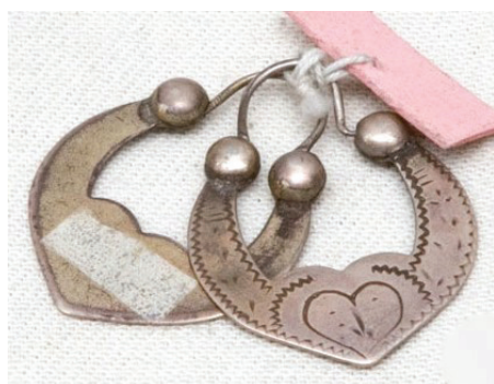
Рисунок 1 – Кольцевые серьги ай сырға . КП 6705-1162 КНММИИ им. Г. Айтиева