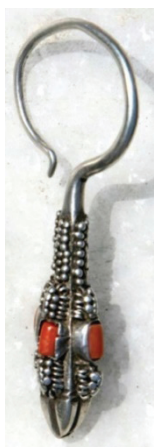
Рисунок 6 – Цельнокованные серьги көз койгон сырга . КП 15358-3387 КНММИИ им. Г. Айтиева