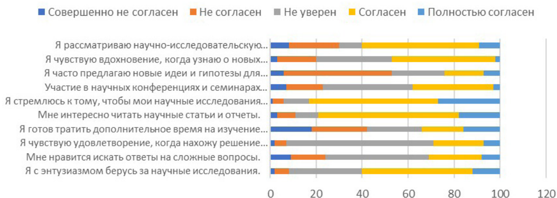
Рисунок 1 – Результаты опроса по критерию “Познавательный интерес”

развития молодёжи в контексте профессионального образования [6].