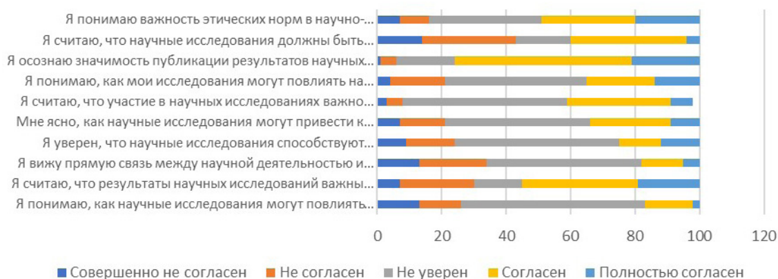
Рисунок 3 – Результаты опроса по критерию “Понимание значимости научно-исследовательской деятельности”

Таким образом, результаты исследования мотивационного компонента готовности показали низкие результаты мотивации магистрантов к научно-исследовательской деятельности.