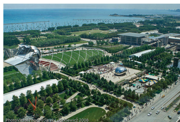
Рисунок 3 – Millennium Park, Чикаго, США. Карта. Фрагмент