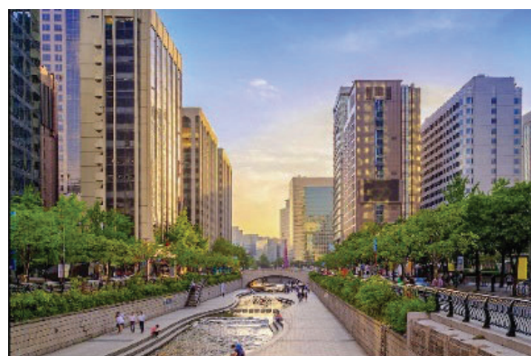
Рисунок 2 – Cheonggyecheon Stream, Сеул, Южная Корея