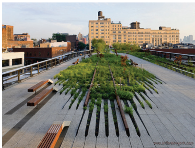
Рисунок 1 – Парк High Line, Нью-Йорк, США. Карта. Фрагмент